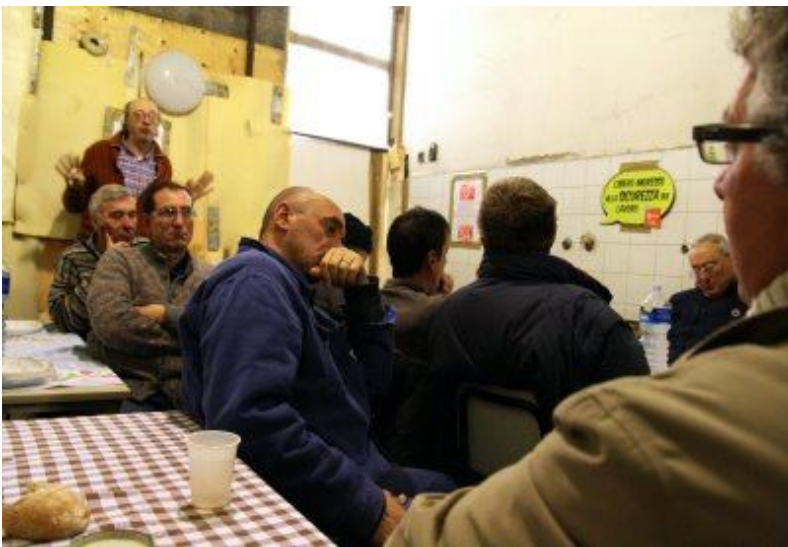
CAPODANNO ALLA INNSE