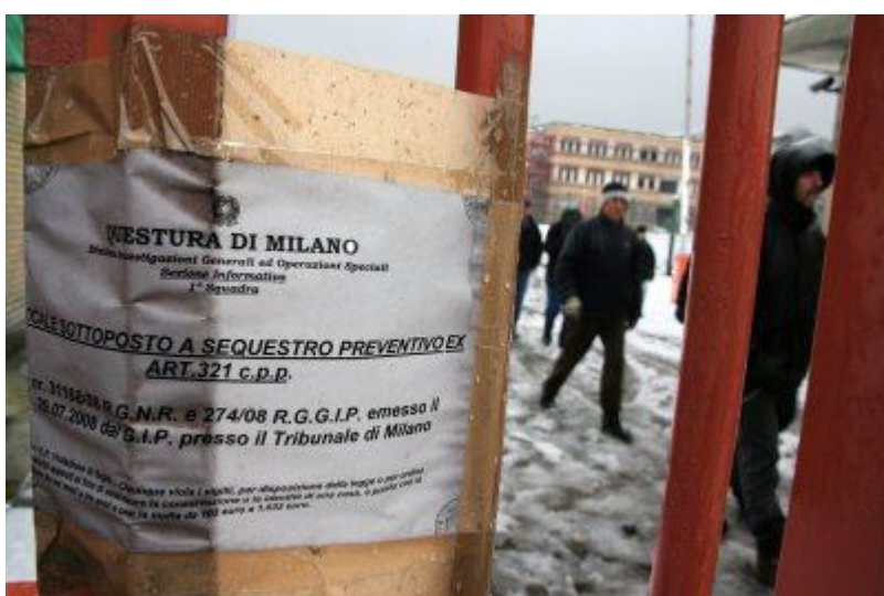
IN PRESIDIO AI CANCELLI