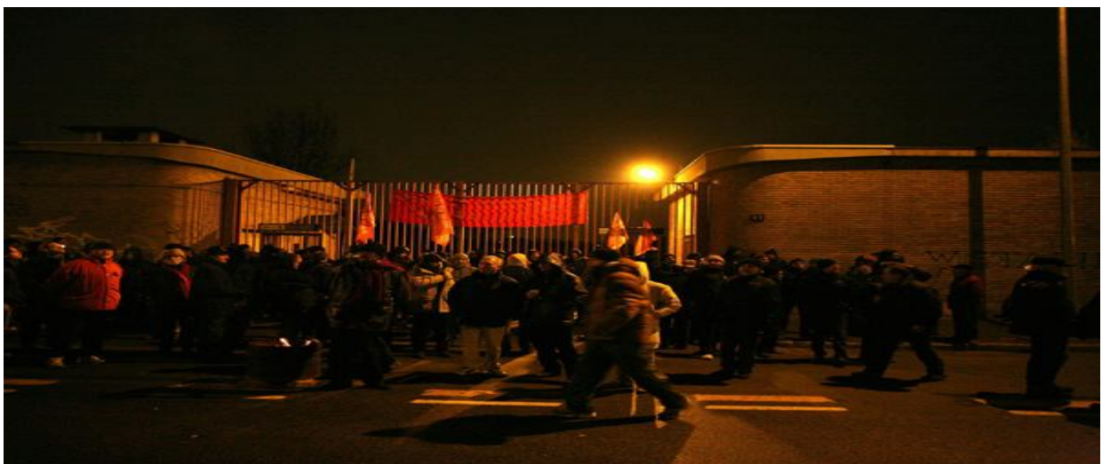
PRESIDIO DELL'11 FEBBRAIO 2009